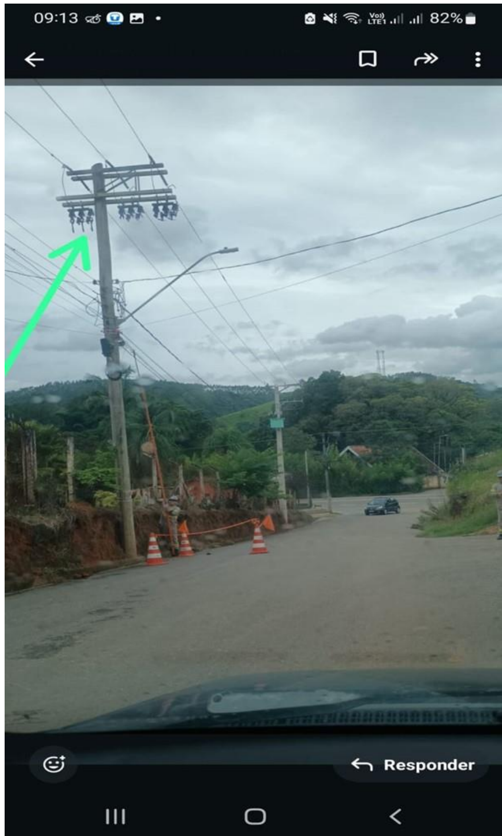
Foto que exemplifica o que está ocorrendo na região.