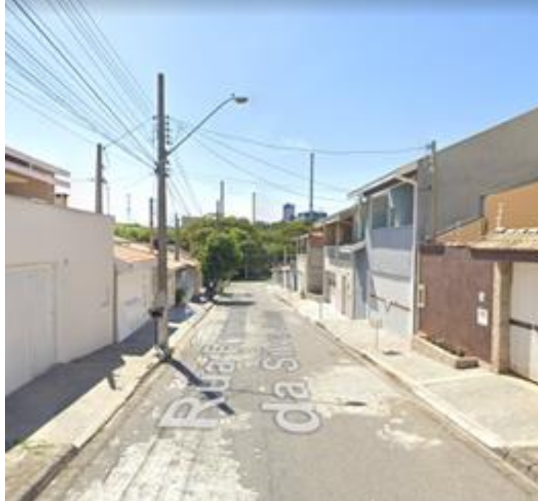
Foto 1: Rua Francisco Leite da Silva Júnior, próximo ao número 69, no Jardim Altos de Sant'Anna II