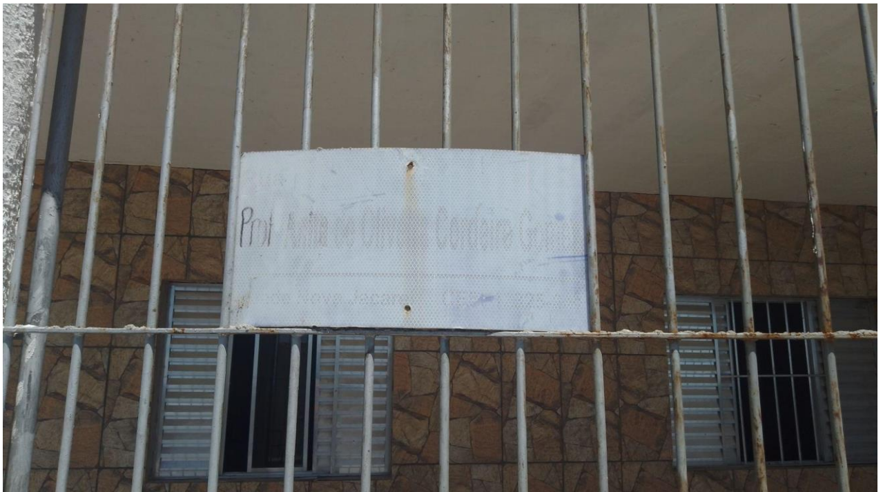
Foto: Placa de Identificação de Logradouro (PIL) Rua Professora Anita de Oliveira Cordeiro Gomes - Cidade Nova Jacareí.