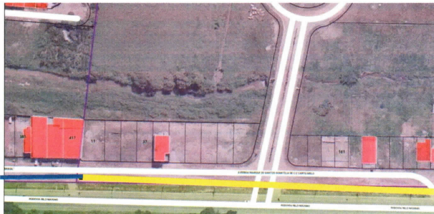
■ Trecho imóvel ao lado do 1305 até o número 11 sentido centro – Av: Marquesa de Santos – Domitília de Castro Canto e Melo