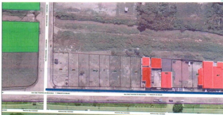
■ Trecho imóvel 417 até o imóvel 255 sentido centro. – Rua Dom Teodósio de Bragança – 1º Príncipe do Brasil.