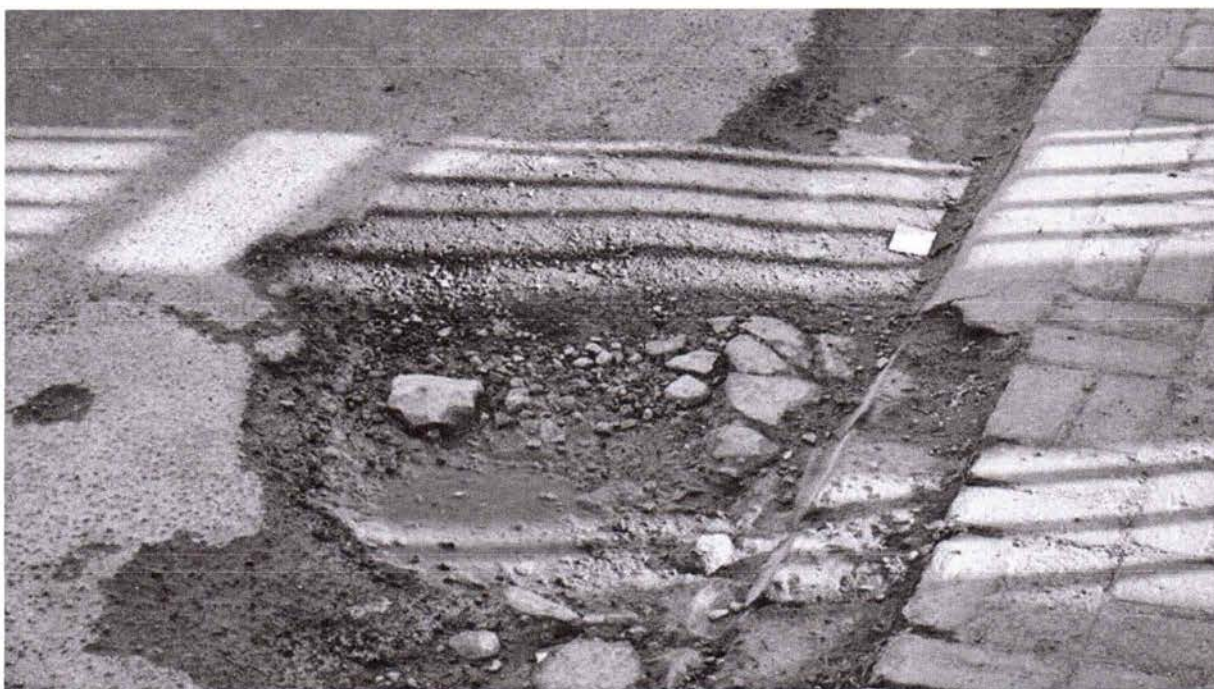
Fotos 1 e 2: Rua Oakland, em frente ao número 119, no Jardim Califórnia