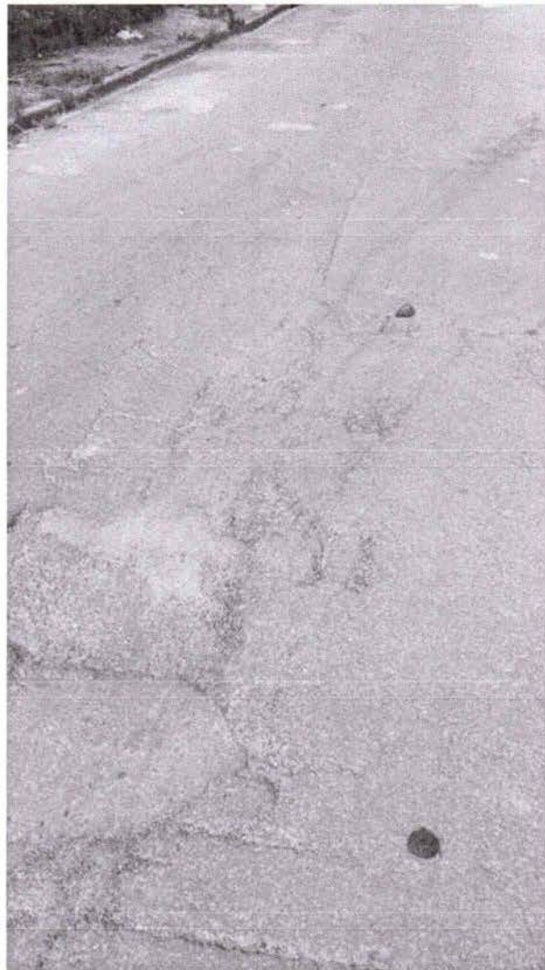
Fotos 3 e 4: Rua André Luiz, trecho entre os números 188 e 434, no Bairro Cidade Salvador