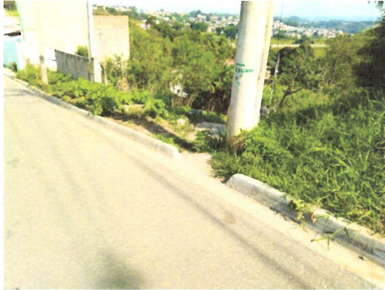
Foto da Rua Dois (escadaria que liga as duas ruas e que serve de caminho para escoamento da água)

Foto da Rua Dois (trecho sem guia que serve de caminho para escoamento da água)