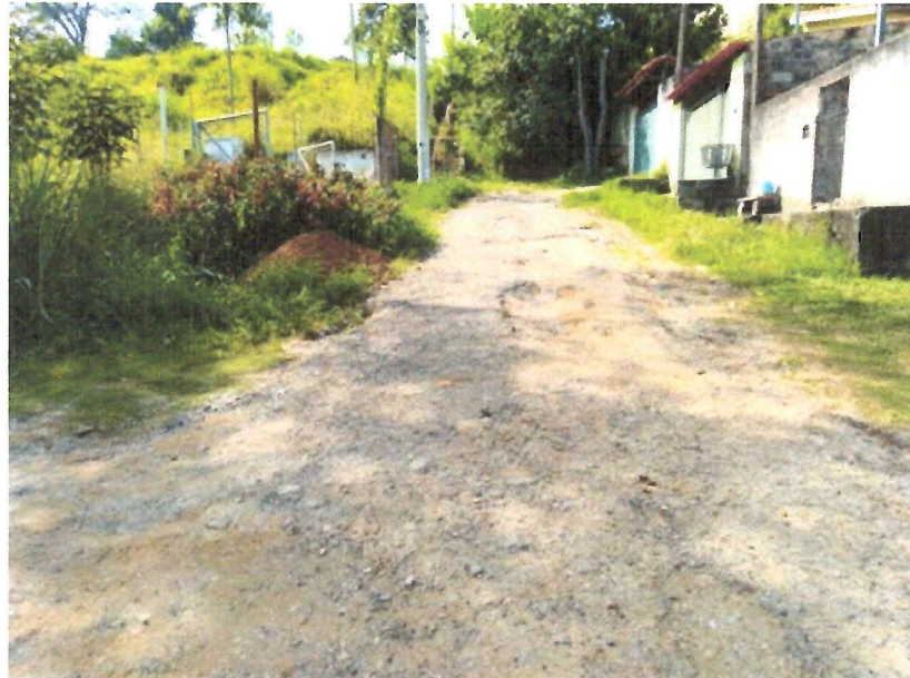
Foto da Rua Cinco (buracos e má conservação causados pela água desce da Rua Dois)

Foto da Rua Cinco (ao fundo a escadaria que serve de caminho para a água, buracos e má conservação da via)