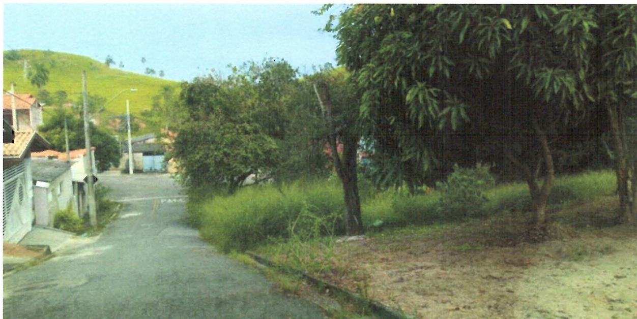
FOTO: Área tomada por mato na Rua Miguel Couto, no Jardim Nova Esperança.