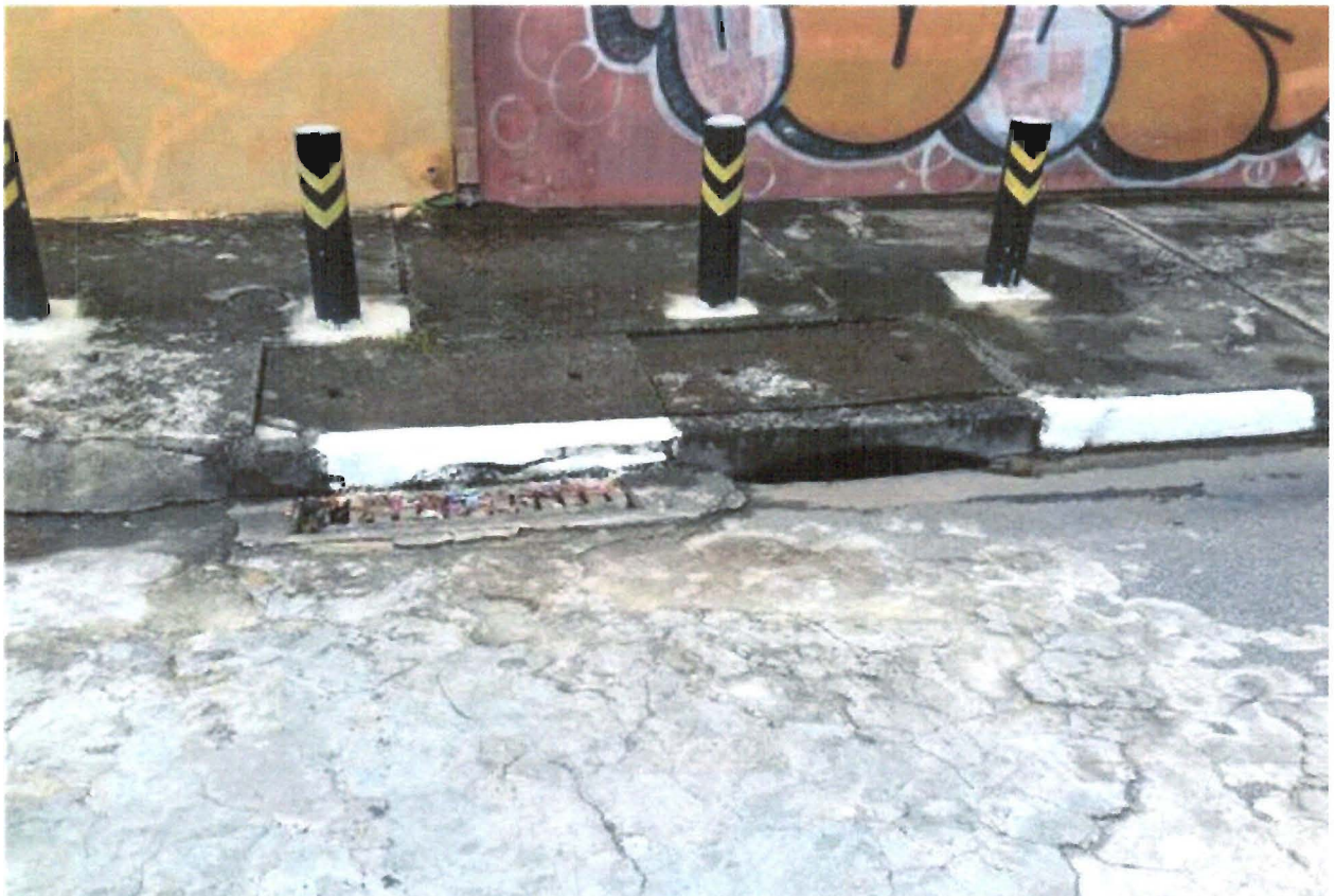
FOTOS: Bueiro nas proximidades do nº 358 da Rua Cruzeiro, no Bairro Cidade Salvador.