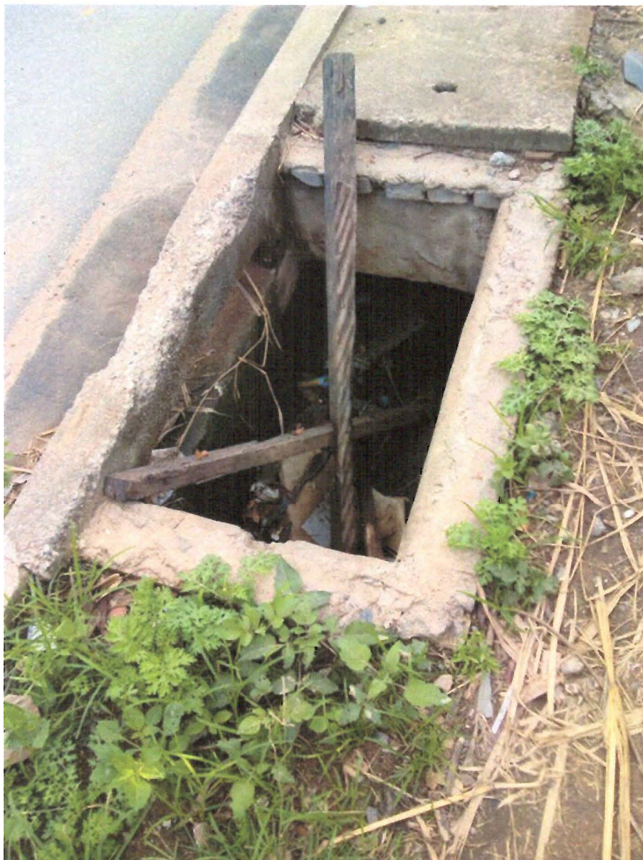
FOTO: Bueiro sem tampa defronte do nº 233 da Estrada do Imperador, no Bairro Rio Comprido.

Indicação nº 885/2019 - ARILDO BATISTA - fls. 2/2